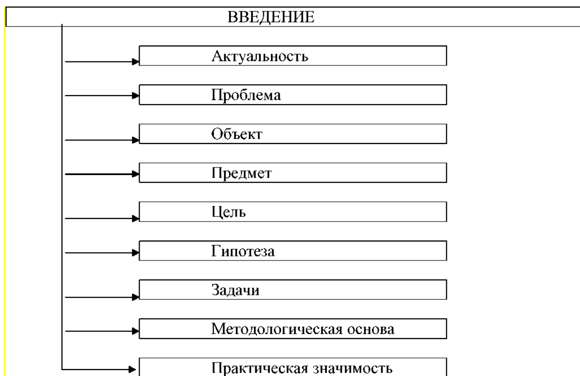
Рисунок 2.2 – Структура введения

Актуальность исследования. При выборе темы исследования необходимо оценить ее актуальность, которая может определяться следующими факторами: